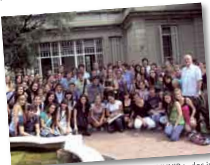
• Cursos de nivelación de las carreras del IUNIR todos juntos!