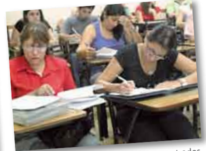
• Alumnos de la Licenciatura muy concentrados