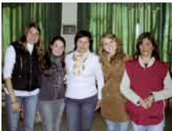
• Hogar del Huérfano

La unión hace la fuerza. Así lo han entendido desde UPROS. Los lazos se fortalecen, se amplían, crecen y van hacia delante. Todo ello con un fuerte compromiso de calidad educativa, contribuyendo al desarrollo de la región.