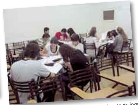
• Ingresantes a la carrera de Psicología en el curso de ingreso