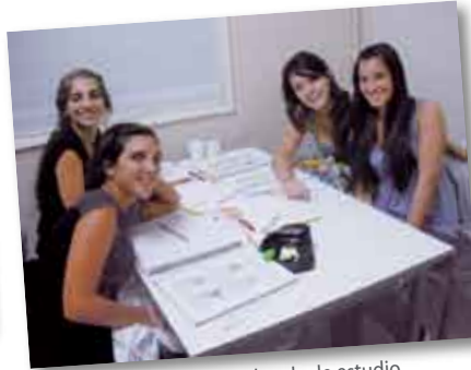
• Alumnas de medicina en la sala de estudio