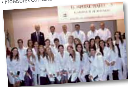
• Alumnos de Medicina Becados