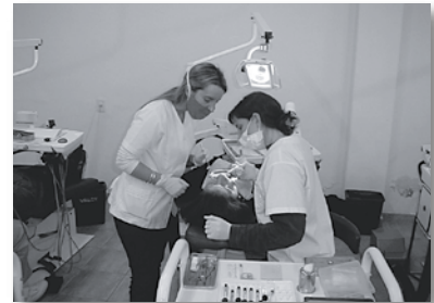
• Alumnas en las instalaciones del COR

Además, se encuentran desarrollándose los proyectos de las Carreras de Especialización en Periodoncia, Endodoncia, Ortodoncia, Odontopediatría y Cirugía Buco Maxilo Facial, cuya implementación se espera poder realizar progresivamente en un futuro próximo.