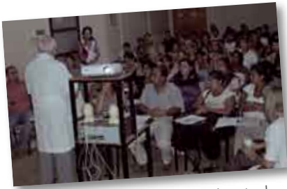
• Ingresantes a la Lic. en Enfermería durante el curso de nivelación