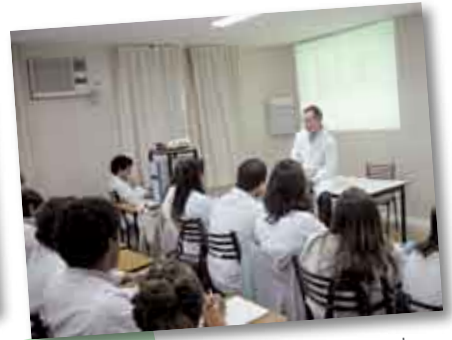
• Alumnos de 3º año de Medicina en una de sus clases