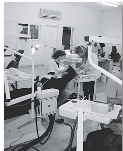
• Ambiente de trabajo en el COR