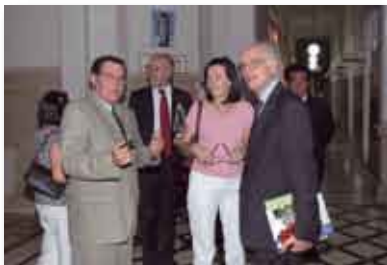
• Autoridades Italianas visitan el HIG y la sede del IUNIR