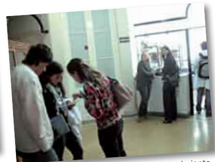
• El pasillo de la planta alta con mucho movimiento