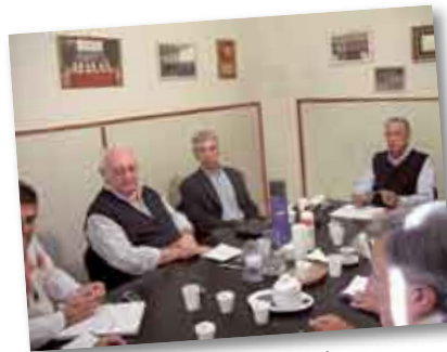
• Reunión semanal de las Autoridades