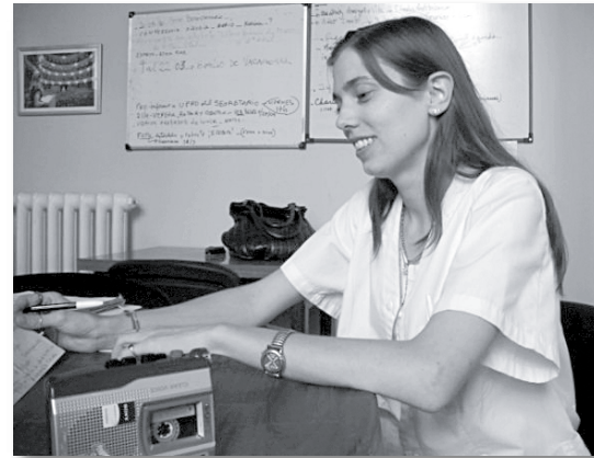
• ...En la entrevista

Si todavía no se postuló para una beca y está en la búsqueda de una especialización, le sugiero que se anime. Es importante cualquier instancia: ya