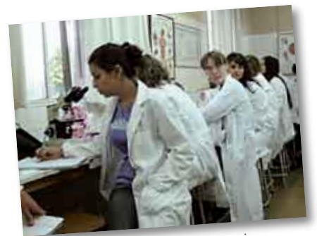
• Alumnas de medicina en el Laboratorio