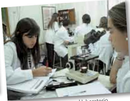
• Las chicas concentradas en el laboratorio