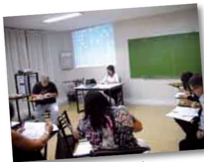
• Alumnos de la Maestría en plena clase