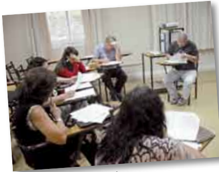
• Estudiantes de la Maestría