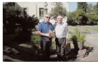
• La autoridad italiana en su visita al IUNIR