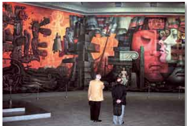
• Autoridades del IUNIR frente al Mural J. G. Camarena (Universidad de Concepción)