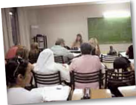
• Estudiantes de la Lic. en Enfermería en clase