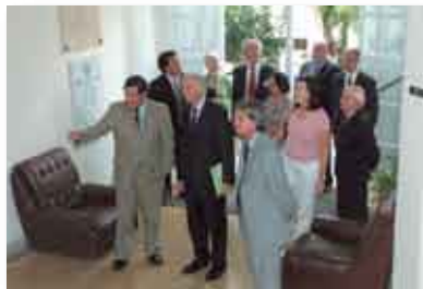
• El Rector del IUNIR, el Embajador de Italia y el Presidente del HIG