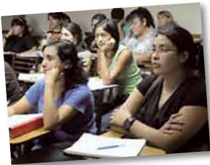
• Licenciatura en Enfermería