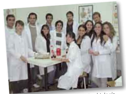
• Alumnos 3º año en laboratorio microbiología