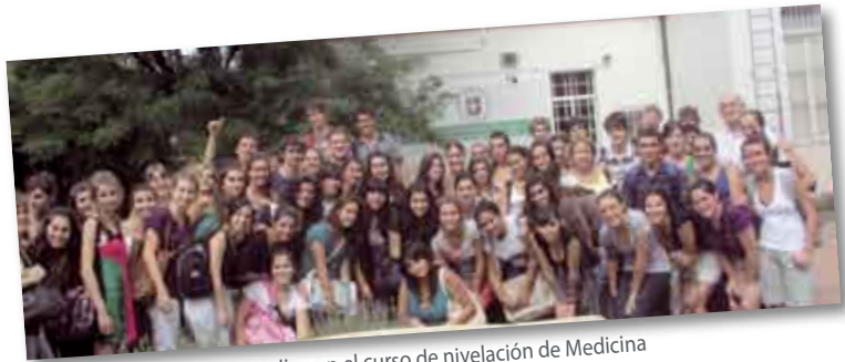
• Grupo de alumnos que realizaron el curso de nivelación de Medicina