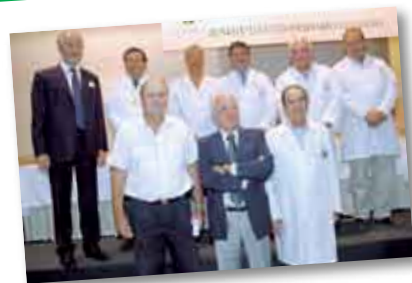
• Profesores Consultores

Por último, las autoridades del IUNIR hicieron entrega de las Medias Becas al Mérito Académico 2010 a los estudiantes. 20 alumnos de Medicina y 8 de la Lic. en Enfermería recibieron sus correspondientes certificados.