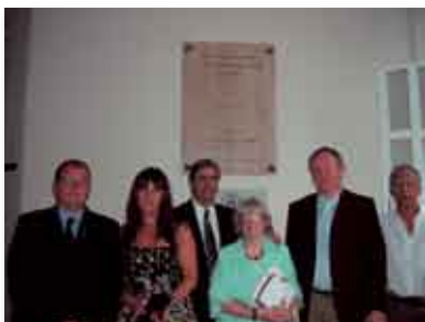
• Autoridades del IUNIR con las visitas