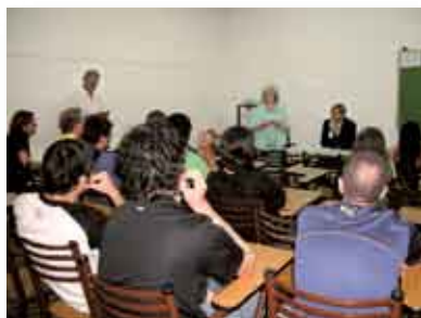
• Conferencia sobre Sistema Sanitario Italiano